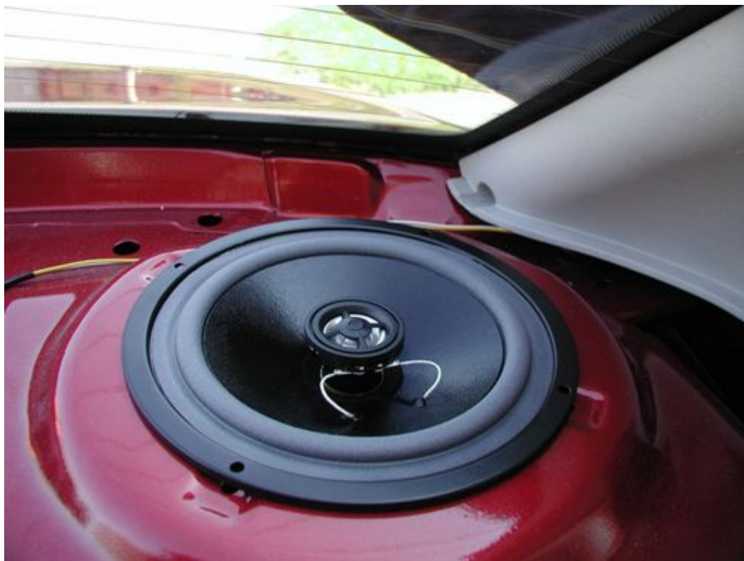
Установка Динамиков В Задние Двери Калины